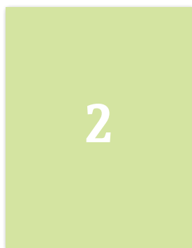
2. strana obálky