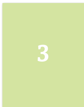
3. strana obálky